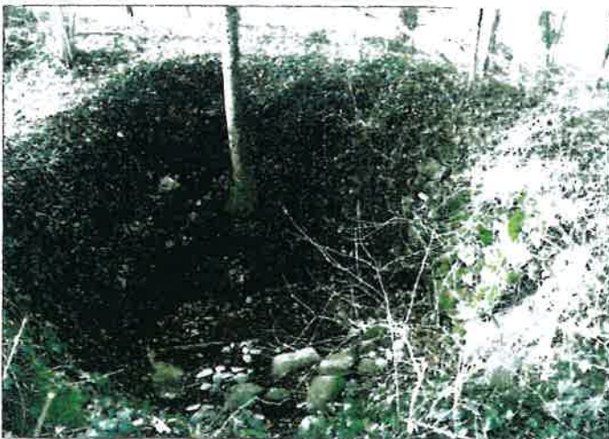
une glacière (à restaurer)