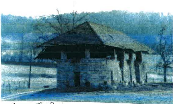
La Tuilière : avant ... et