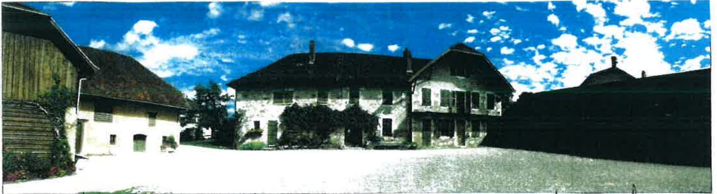
Mas des Jacobins : ferme et maison de maître.