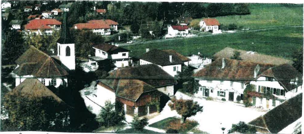
Chief-lieu : église, ancienne école, mas des Jacobins